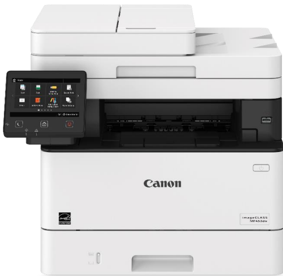
Muestra de MF453dw